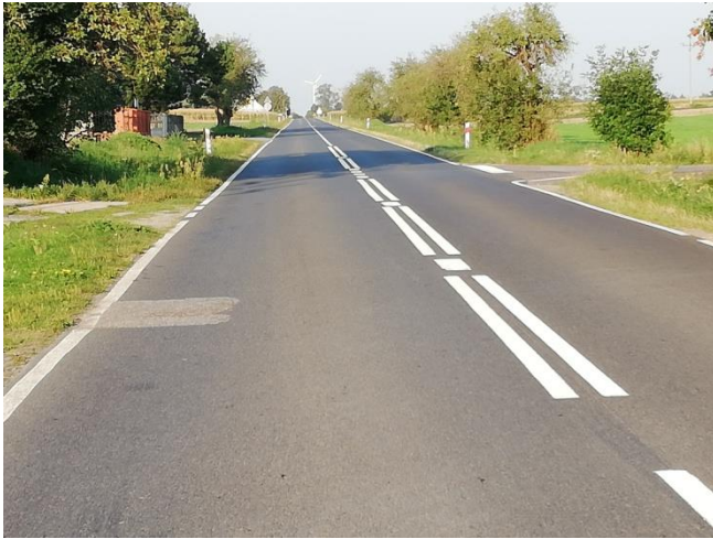
Droga dojazdowa do miejscowości Ratyń