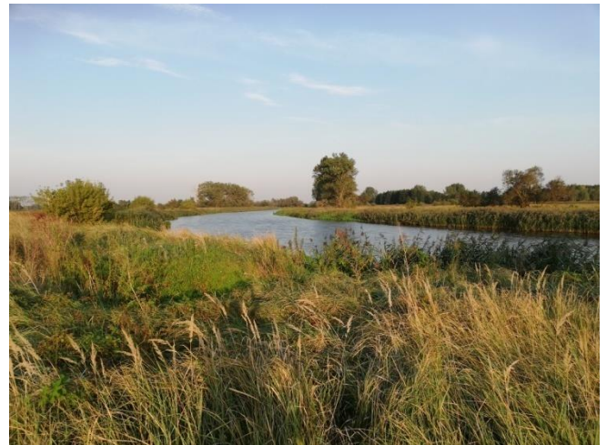
Nadwarciański Park Krajobrazowy i rzeka Warta