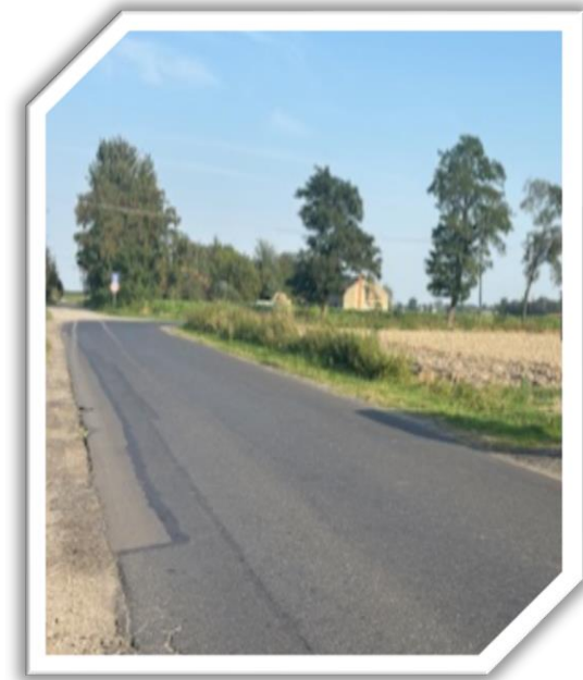
Droga w sołectwie