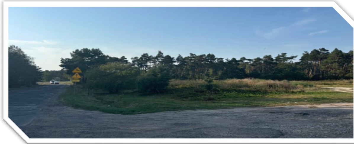
Teren pod zabudowę