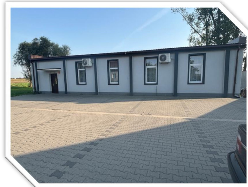
Remiza OSP/Świetlica wiejska